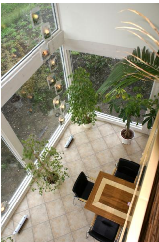
■ Blick von der Galerie