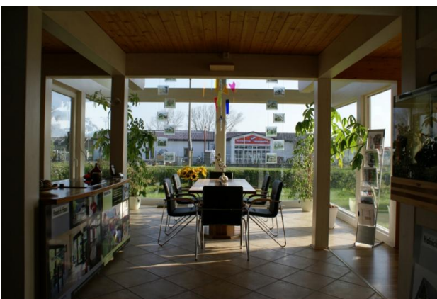
■ beste Aussichten