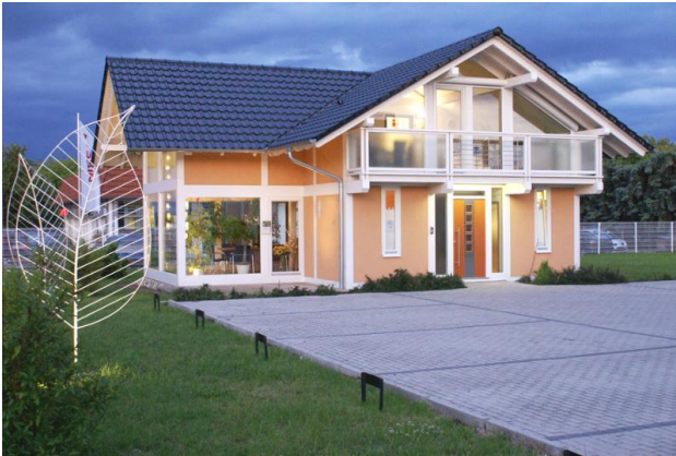
■ viel Platz für Gäste