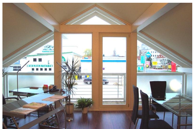
■ oberes Büro