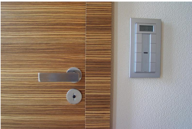
■ BUS-Technik im ganzen Haus