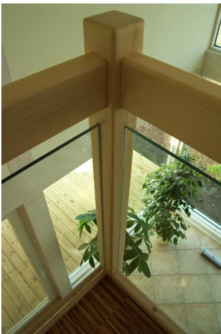
■ Blick von der Galerie