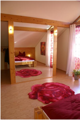
■ begehbare Schrank