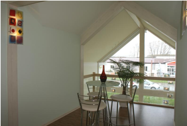
■ obere Etage Flur