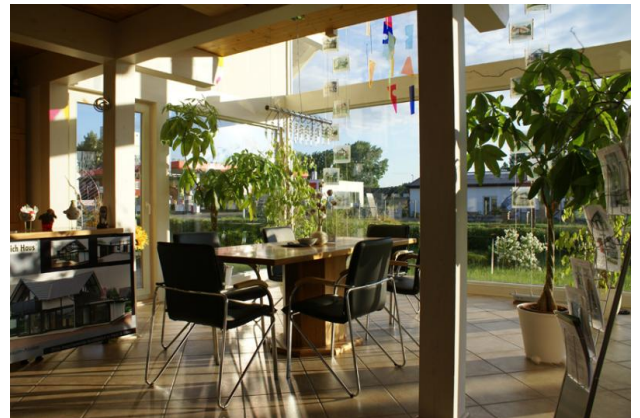
■ untere Etage